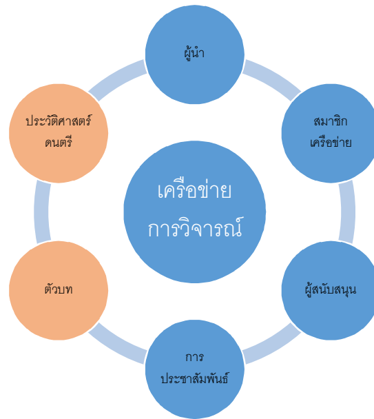
แผนภูมิโมเดลเครือข่ายการวิจัยคนตรี